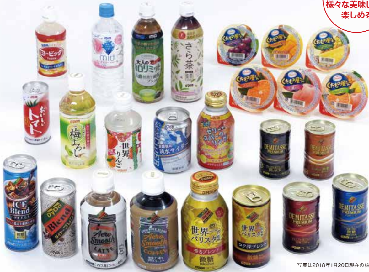
写真は2018年1月20日現在の株主への贈呈例