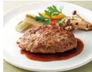
【滋賀】 近江牛と黒豚のハンバーグ