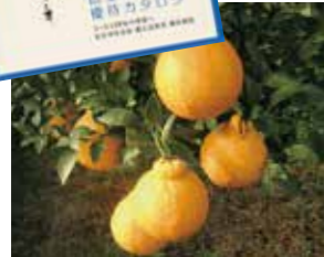
【徳島】 不知火 (デコボン)