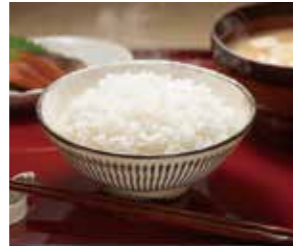
【熊本】 熊本県産 森のくまさん