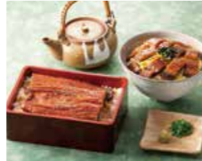
【静岡】 うなぎ蒲焼セット