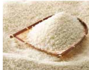
【新潟】 特別栽培米 魚沼産こしひかり