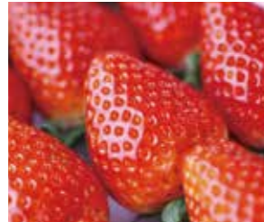
【宮城】 ミガキイチゴ餃合せ