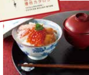
【北海道】 海鮮三色丼セット