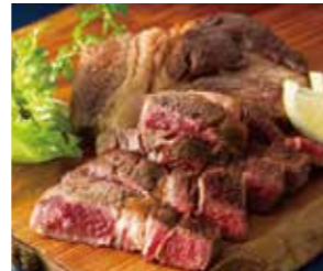
【岡山】 国産牛の熟成ステーキ

※全国特産品の受取りに代えて、寄付を選択することも可能。※上記は2017年9月末の優待内容であり、毎年見直しを行っている。